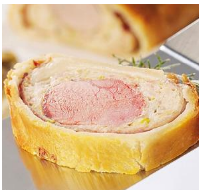
Filet im Blätterteig