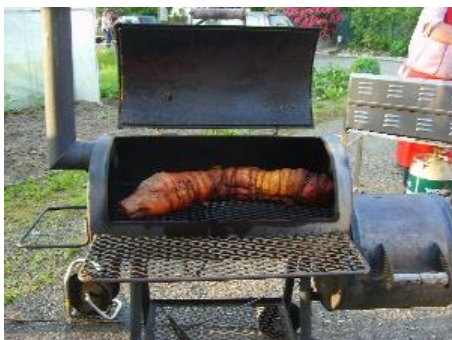
Spanferkel vom Grill