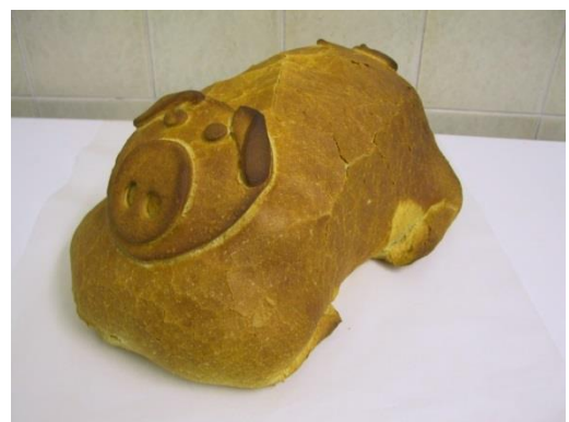
Schinken im Brotteig